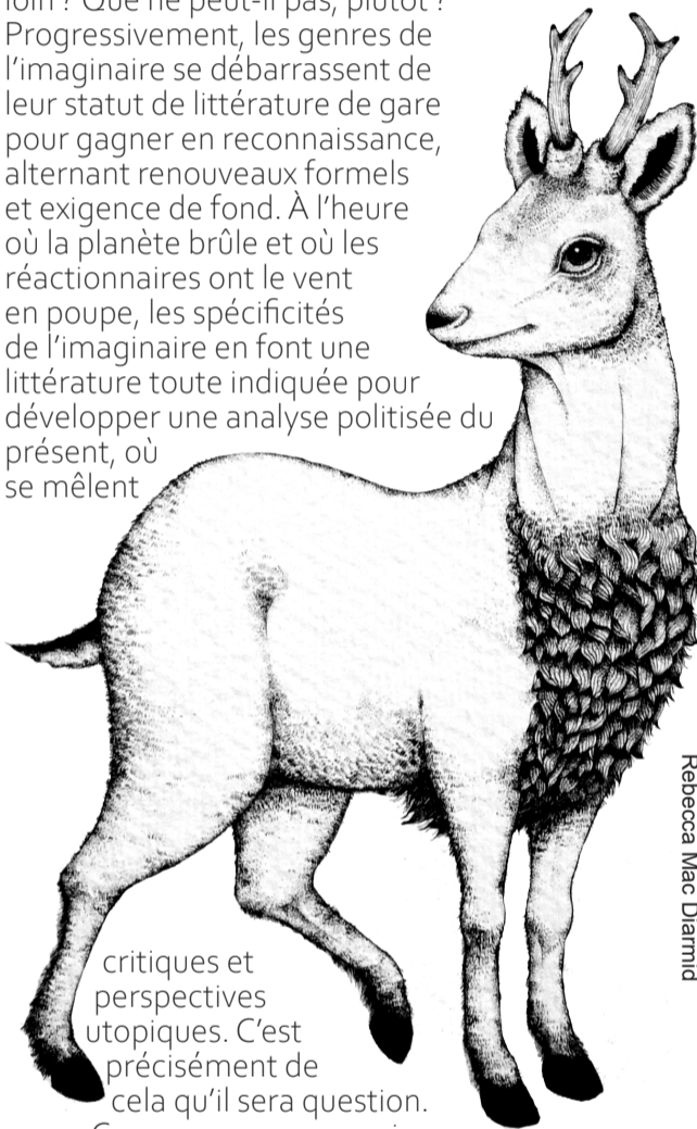
Biche-Naine, extrait d'un bestiaire péninsulaire Rebecca Mac Diarmid

Longtemps reléguées à la marge, boudées par la critique et méprisées par les académiciens, les littératures de l'imaginaire incarnent de fait l'une des formes les plus radicales de la fiction : l'on y invente non seulement des récits, mais également des mondes. Que peut l'écrit lorsqu'on le laisse aller aussi loin ? Que ne peut-il pas, plutôt ? Progressivement, les genres de l'imaginaire se débarrassent de leur statut de littérature de gare pour gagner en reconnaissance, alternant renouveau formels et exigence de fond. À l'heure où la planète brûle et où les réactionnaires ont le vent en poupe, les spécificités de l'imaginaire en font une littérature toute indiquée pour développer une analyse politisée du présent, où se mêlent